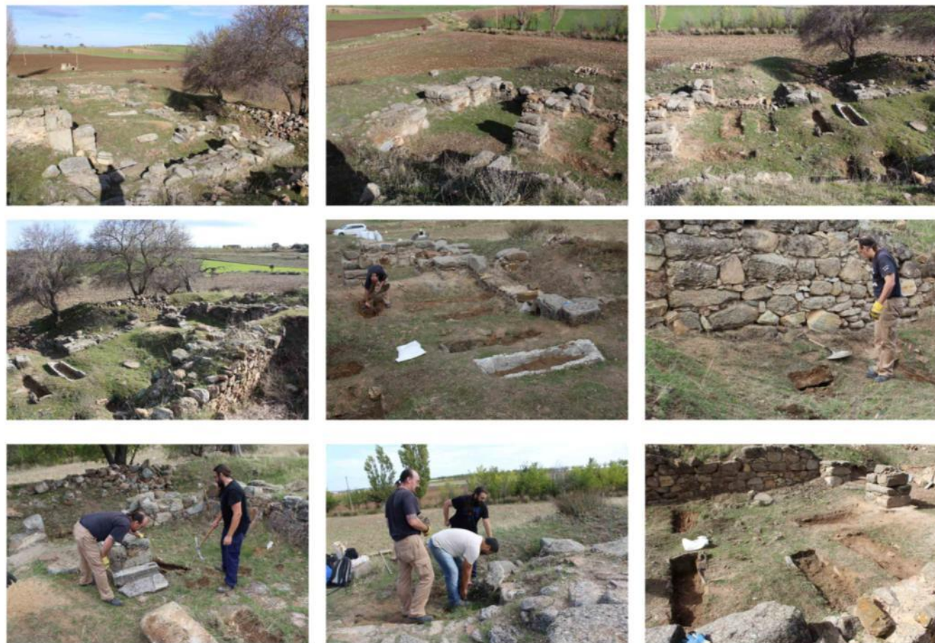
Campaña de limpieza en el yacimiento de Los Hitos

Por último, no se ha querido dejar de lado la labor divulgativa y se ha procedido a rediseñar el Museo de la Cultura Visigoda de Arisgotas. Como complemento de este museo se ha realizado una ruta a través de los restos conservados en distintos puntos de la localidad y se ha editado un tríptico y una pequeña monografía que incorpora las nuevas interpretaciones, así como una página web cuyos contenidos (trípticos y guía del yacimiento) son de acceso libre y pueden descargarse y consultarse en cualquier dispositivo móvil (Figs. 3 a 5).