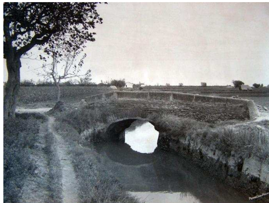
Pont al canal principal de Montcada. Fotografia antiga.

reflexions en públic és un procés de contracció de la disciplina en ambients exclusivament universitaris i professionals, cosa que ha passat en moltes altres especialitats acadèmiques. Crec que això, en una gran mesura, respon a una dinàmica més global que té a veure amb la desconexió de la funció social de moltes activitats professionals; i per mi, aquesta desconexió es deu sobretot a la pèrdua de consciència de classe.