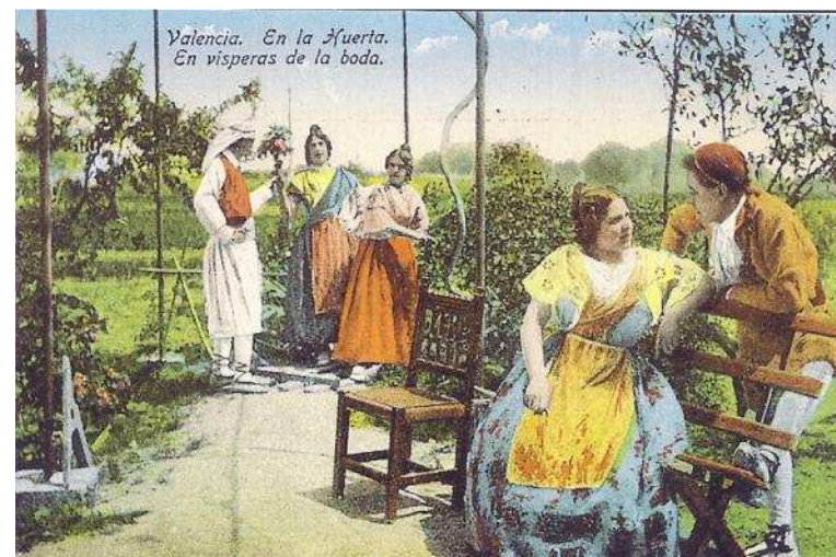
Imatge bucòlica de l’Horta de València. 1918.

Encara que comparteixo el fons de la vostra apreciació inicial, potser, matisaria una mica aquest comentari sobre estar encara lluny d’una fase d’estima social respecte a l’Horta. Les mobilitzacions ciutadanes dels darrers anys —i no parle només de la Iniciativa Legislativa Popular per l’Horta, o de les nombroses esmenes ciutadanes al Pla d’Actuació Territorial de l’Horta (PATH) enllestit des del govern autonòmic—, indiquen un important interès i sensibilitat respecte la seua protecció.