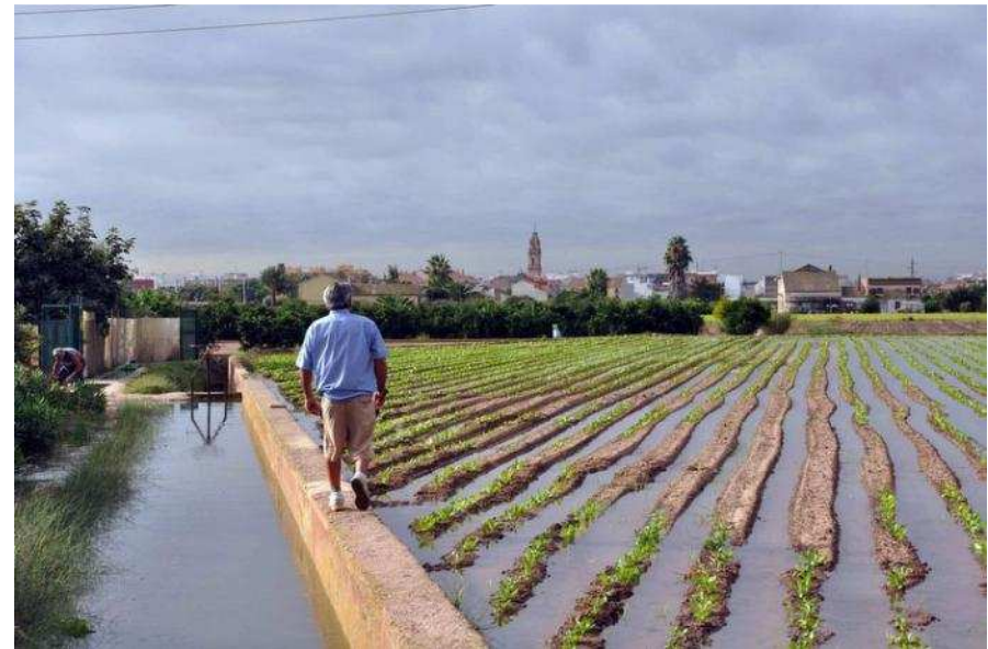
Reg de parcel·les a l'horta.

a la nostra concepció holística del paisatge, sinó també, en el desplegament de la seua arquitectura multimèdia. Aquesta última ha estat possible gràcies al software fet a mida que ha posat al nostre abast l'empresa Xip Multimèdia, a qui també tenim que agrair les contínues suggerències, millores i ajustos en la manera de mostrar i desenvolupar els continguts d'una manera el més adient possible dins l' ecosistema digital.