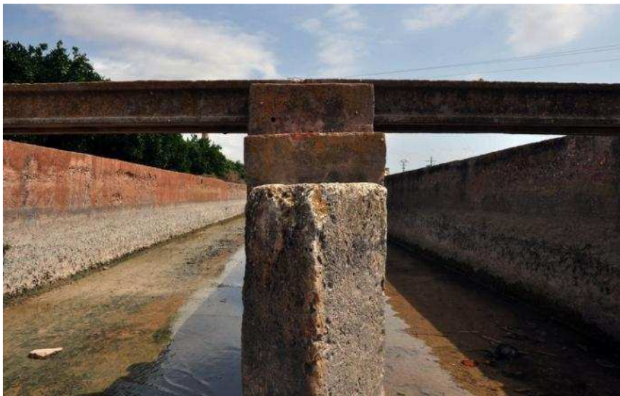
Partidor a les llengües del Puig i Puçol.

de pes en la presa de decisions finals sobre les polítiques de gestió del territori municipal.