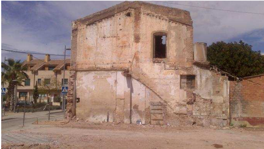
Paret d'obra de tàpia medieval