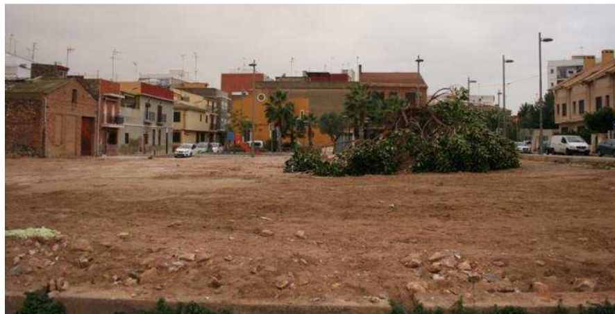
L'espai abans ocupat per l'alqueria