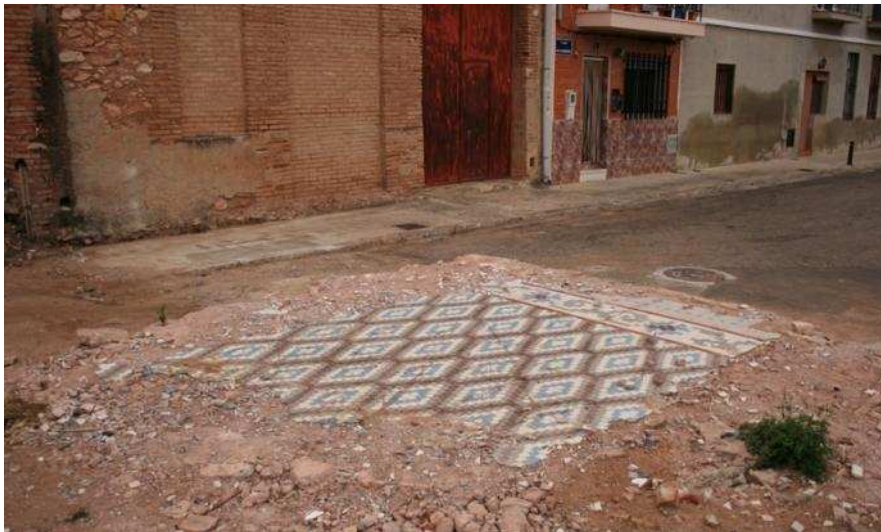
Única resta que es manté (de moment) de l'alqueria