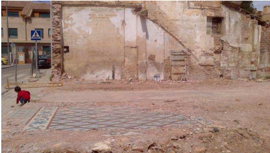
Restes del paviment modernista d'una de les parts enderrocades a l'any 2012