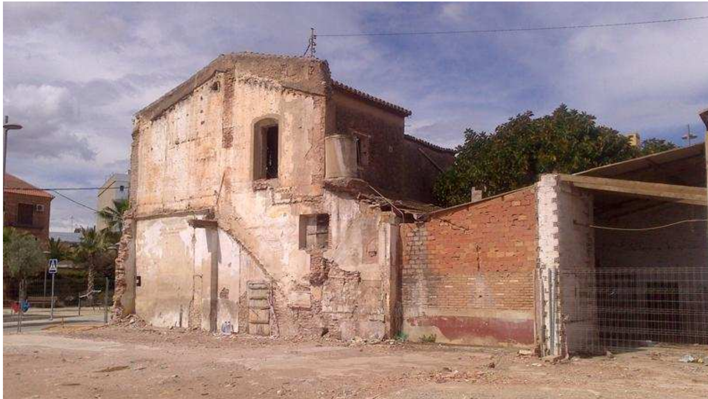
Part de l'alqueria de Macana, abril 2013, després de l'enderrocament del cos del s. XVIII

De la seua importància ens havíem fer ressò allà per l'any 2003 a una publicació pagada pel propi consistori municipal, però, malauradament, sembla que cap dels responsables municipals d'aleshores i d'ara s'havia llegit aquest llibre d'història local on a les