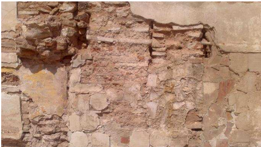
Restes de murs del segle XV a