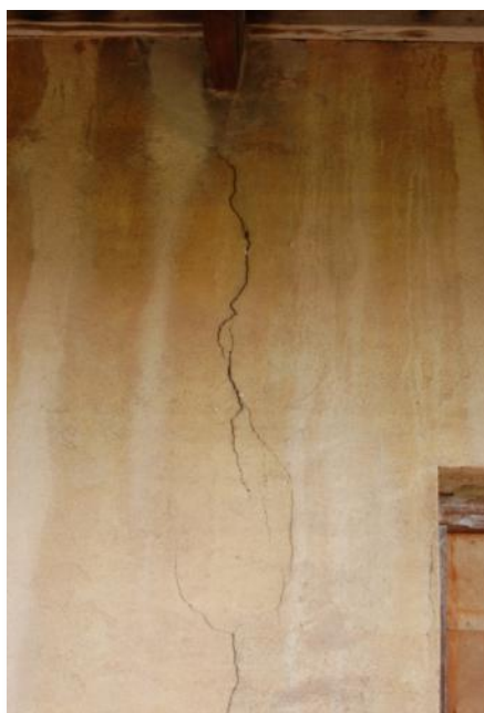
Algunas de las patologías anteriormente mencionadas. Los problemas mecánicos del soporte se encuentran presentes en todo el conjunto arquitectónico.