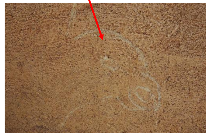
Detalle de uno de los nuevos graffitis en el que se representa un águila, asociada a la simbología franquista.