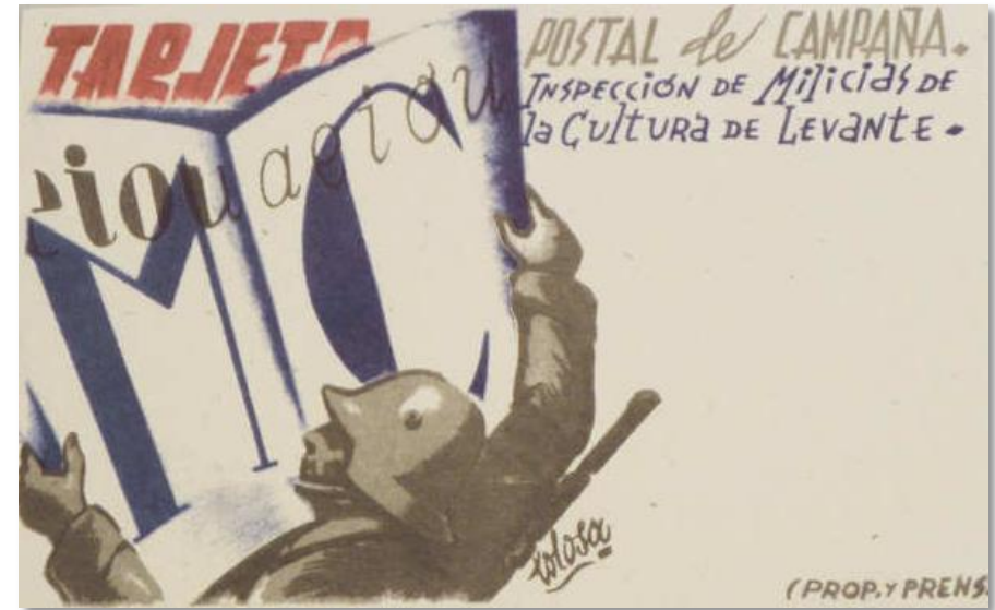
Tarjeta postal de campaña con una iconografía similar a la que presenta la inscripción estudiada.

Ministerio de Instrucción Pública que, en el frente de guerra, se llevaba a cabo mediante las denominadas “Milicias de la Cultura”. “Ejemplos de esta campaña los encontramos sobre todo en los abundantes carteles editados por el Ministerio de Instrucción Pública destinados a concienciar a los soldados en la necesidad de aprender a leer y de culturizarse. Así vemos carteles con consignas similares como “Leed. Combatiendo la ignorancia derrotareis al fascismo”, “Las Milicias de la Cultura luchan contra el fascismo combatiendo la ignorancia”, “Para asegurar la victoria estudiemos la técnica militar” o “El analfabetismo ciega el espíritu. Soldado instrúyete”. Con referencia al dibujo que ilustra la inscripción, la iconografía utilizada está inspirada, posiblemente, en algunos de estos carteles editados durante la guerra por el Ministerio de Instrucción Pública”. 23