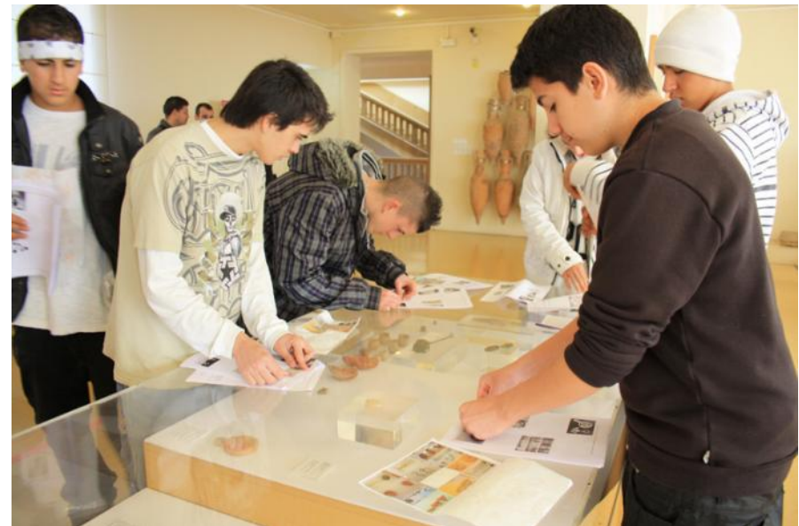
Alumnos de atención a la diversidad en una actividad didáctica en el Museo Nacional de Arqueología de Tarragona.

KEY WORDS.- archaeological education, education, research, training programs.