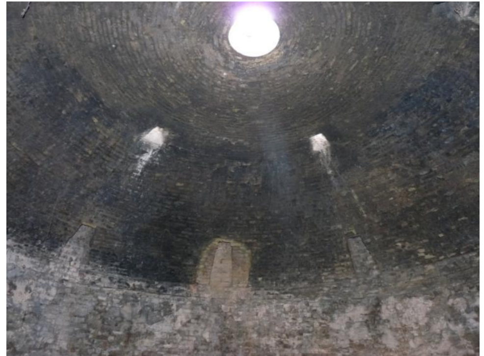
Alcova d'un dels 15 forns tipus àrabs existents

de plantejar un programa mínim d'actuacions i que no són altres que el recel dels propietaris i la manca d'ajudes per a sufragar les intervencions.