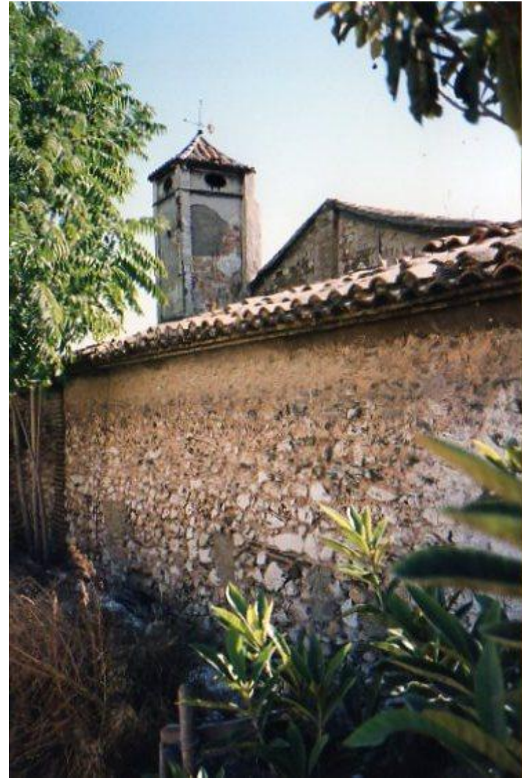
Fàbrica de finals del S.XVIII

Temàtic de la Ceràmica. Barri d'Obradors i posava les bases del que havia de ser el futur projecte, ja clamava perquè s'hi fera amb urgència una catalogació exhaustiva. Aquesta eina imprescindible mai no es va dur a terme, tret d'un apartat d'inventari, pobre i superficial fins al punt de no merèixer ser considerat com a tal, que figurava en l'únic projecte seriós que estigué present en l'escenari de les actuacions durant el període esperançador 1999-2003. Després, la política es capgirà de colp i el procés es precipità en barrina cap a un final que s'intuïa inevitable –d'ací la fatalitat que figura al títol del llibre–, però del que no podem ni imaginar l'abast i la contundència en què acabaria materialitzant-se, amb l'enderrocament massiu de tots els edificis entre juny del 2009 i agost del 2010. El llibre, que desgrana tot aquest procés i en especial el seguit de decisions polítiques que de manera subreptícia acabaren imposant-se pel corró de la majoria absoluta del PP, deixa constància de les contradiccions en què s'ha vist immers un poder municipal, embriac de bombolla immobiliària, que fins al darrer moment i fins i tot després de consumada la desfeta, ha tingut el cinisme de mantenir en paral·lel el discurs de la salvaguarda dels valors històrics i patrimonials que amb l'altra mà estava propiciant destruir.