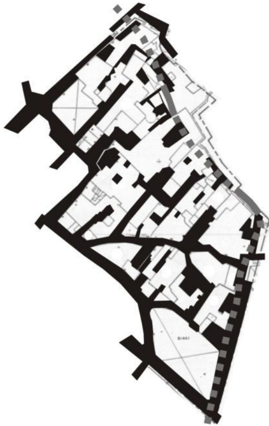
Trama urbana del Barri d'Obradors

contribuït activament a la seua destrucció com a efecte col·lateral d'una aliança d'interessos amb el sector privat en el moment àlgid del cicle d'expansió econòmica immobiliària. Amb la redacció del relat he mirat de deixar el testimoniatge escrit d'aquest trist episodi i preservar-lo de l'oblit.