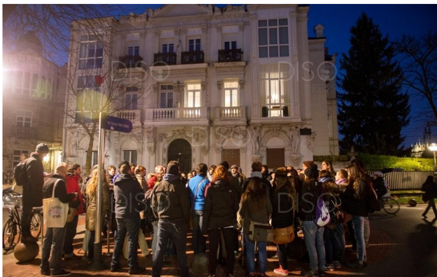
Visita guiada a “La ciudad de Vitoria-Gasteiz en la Guerra Civil”.

desmemoria. Pero todos coincidimos en la visión pública que tiene y debe seguir teniendo esta arqueología para hacer llegar la verdad a la mayor parte de la sociedad.