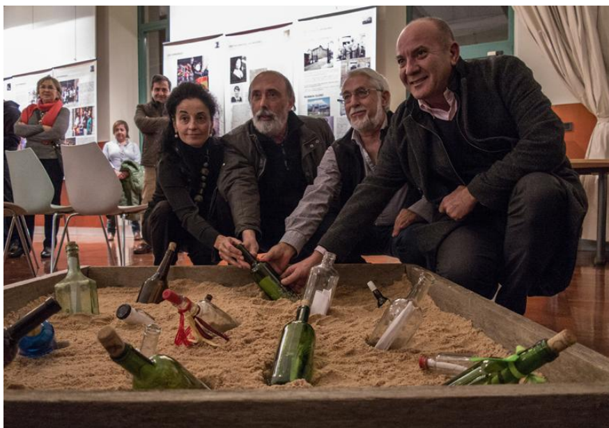
Inauguración de la exposición “Que aflore lo enterrado” en el Pabellón Universitario.

A lo largo de una intensa semana se leyeron numerosas ponencias, un total de 28, y se defendieron unos 18 posters; pero también se inauguraron exposiciones, visionaron documentales, presentaron libros y se visitaron la Gasteiz del contexto de la guerra además de diferentes enclaves del Cinturón Defensivo de Bilbao (también denominado Cinturón de Hierro por la propaganda franquista,