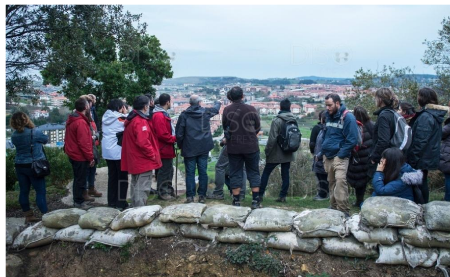
Visita guiada a los “Escenarios de Guerra Civil en Euskadi”.

memoria. Pero resulta muy curioso, como la falta de medios de los proyectos está íntimamente relacionada con una indigencia bastante agravada entre el sector de arqueólogos involucrados en esta disciplina, y que nos aboca a la mendicidad para el desarrollo de nuestras investigaciones y/o excavaciones (Martínez Vallejo, 2014). Esta situación nos convierte (en palabras de Juan Montero), a arqueólogos, antropólogos, conservadores-restauradores, historiadores o médicos forenses en “donantes de tiempo”, en la mayoría de ocasiones.