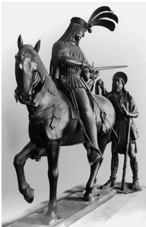
Grupo escultórico del Cavall de Sant Martí.

Y ahora viene la duda que me persigue. ¿Qué miembro en particular de esta élite valenciana contrató y colocó tales azulejos? La pista que hace ya más de 20 años seguí fue la del paralelo con una serpiente, sorprendentemente parecida, que fue esculpida en el grupo en bronce conocido como “el cavall de Sant Martí”, situado en la hornacina que preside la fachada de la iglesia del mismo nombre en Valencia.