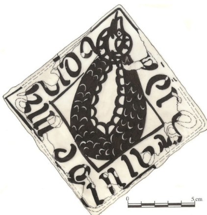
Azulejo con la filacteria Per estalvi de ma vida . Último tercio S. XV.

La modesta pieza en cuestión es un azulejo orientado en losange de 11 cm de lado, decorado con una banda que contiene una filacteria o texto, que corre por los cuatro lados, y un espacio central ocupado por una serpiente estrangulada. Un ejemplar de buena calidad se conserva en el Museo Nacional de Cerámica González Martí, en Valencia, nº de inventario 1-2261.