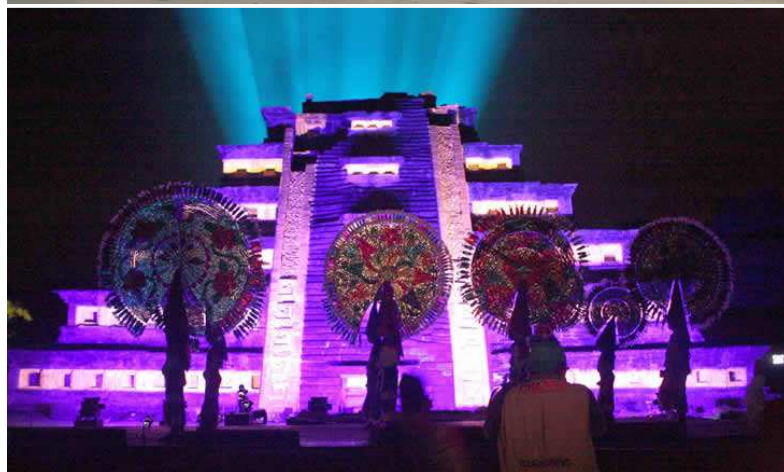
Cuerpo policiaco como parte del operativo de seguridad en Tajín Vive 2016. 3

No obstante a la actuación de este Instituto, hacia su interior convergen de igual manera los distintos intereses que emanan de quienes están a la cabeza, de aquellos que lo administran, de los investigadores, los técnicos y quienes trabajan de manera eventual. Se entretajan aspectos de índole económica, política y sindical, principalmente, ocupando los últimos lugares del top ten la conservación del patrimonio cultural, no obstante a que es una constante en el discurso de cada parte.