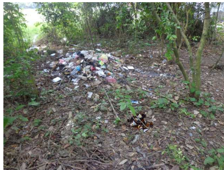
Basura que se ha estado acumulando en las áreas verdes circundantes al acceso de la zona arqueológica El Tajín

Los comerciantes suelen cortar la vegetación para ampliar sus espacios de venta y adecuarlos para optimizar su uso. También utilizan parte de las instalaciones del INAH o quien funja como propietario del inmueble, para elaborar sus informales puestos de venta. El consumo de los alimentos genera desechos que en parte terminan sobre el suelo, y sea por arrastre o sea por depósito intencional en espacios apartados y estrechos, son olvidados y van creciendo estos montones de basura.