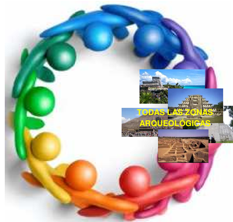
Imagen tomada de:

Por lo tanto, las condiciones de las zonas de monumentos arqueológicos en México, son el reflejo de los valores de quienes tienen el poder o puesto de poder sobre ellas, de quienes las investigan, las conservan, las usan y de todos aquellos que las disfrutamos.