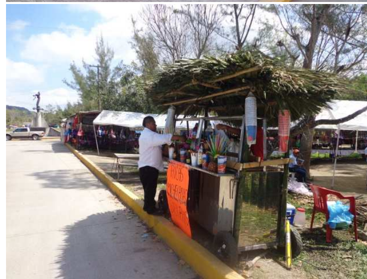
Comercio informal en el acceso a la zona arqueológica El Tajín